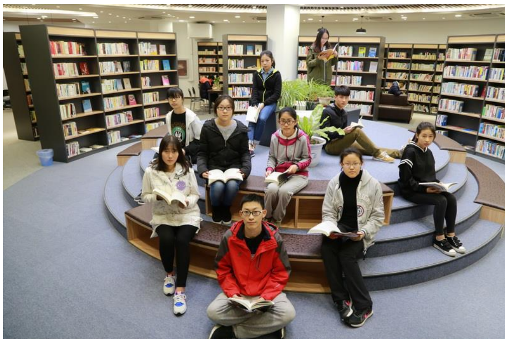
图 1：学生在图书馆快乐阅读