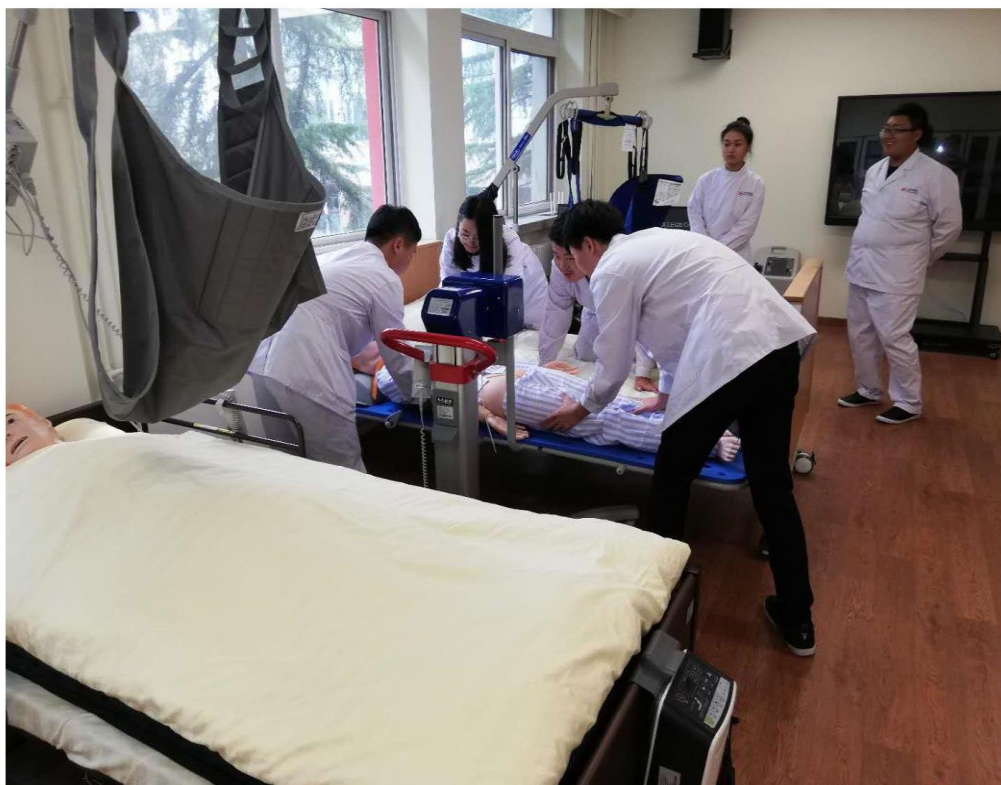
图 3：2017 年建成的养老护理专业实训室