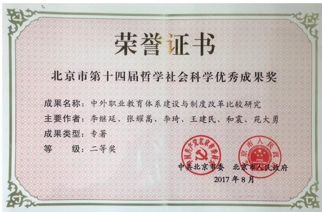
图 4：学院荣获北京市第十四届哲学社会科学优秀成果奖