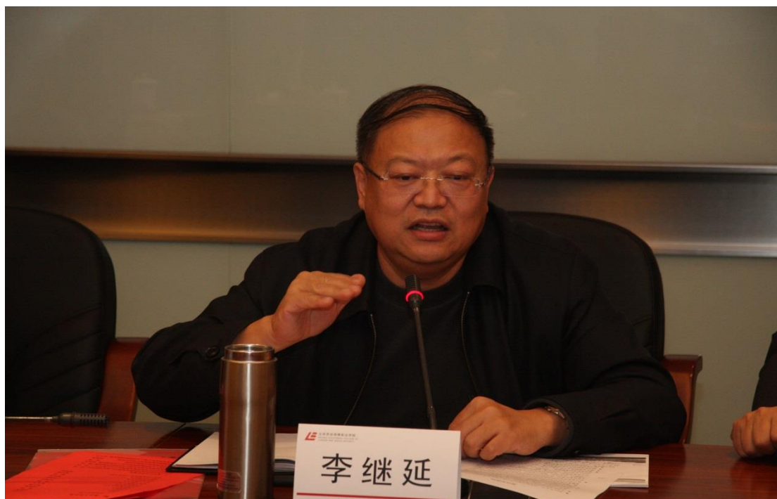
图 5：校企共同研讨教育部现代学徒制试点项目建设

校企共同制定了《试点专业现代学徒制人才培养方案》，制订了试点专业教学标准及实施方案，建立突出职业能力培养的课程标准，建立规范的学徒制课程改革运作制度，以工作情境为载体进行教学方法变革。校企制定试点专业现代学徒制教学进度表，开发基于岗位工作内容、融入国家职业资格标准的专业教学内容和教材。编制师傅选拔标准及实施方案和质量监控标准及相应实施方案，建立了试点专业现代学徒制岗位技术标准。