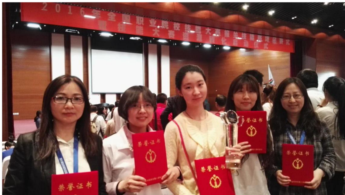
图 7：学院获 2016 年全国高职院校技能大赛报关赛项一等奖