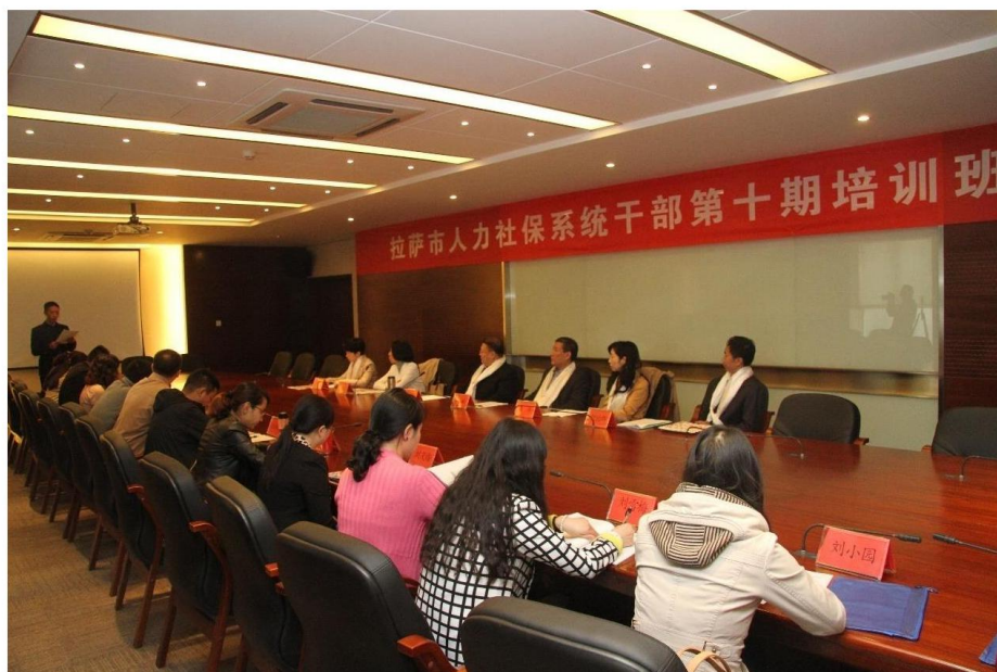
图 8 拉萨市人力社保系统干部培训班开班仪式